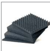
HPRCCF5400W CUBED FOAM