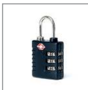
HPRCLO PADLOCK - TSA