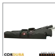
HPRCCB5400W CORDURA BAG